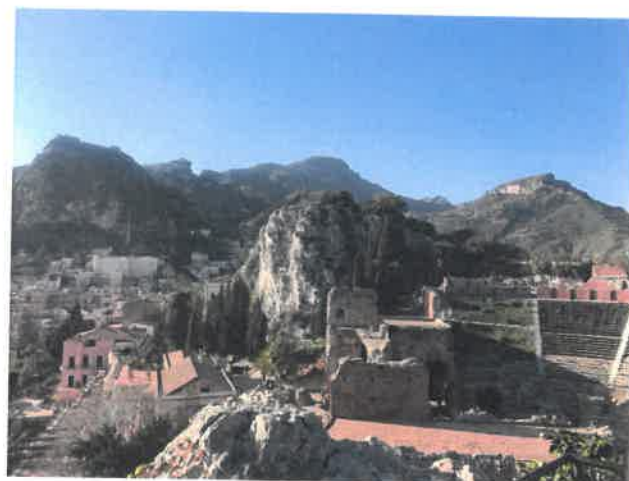
Voyage en Sicile 2019

L'option LCA est complémentaire des autres enseignements au lycée, en particulier du Français, en Seconde et en Première. Sur le plan littéraire nécessairement, mais aussi dans la perspective du retour de la grammaire au lycée : l'étude de la langue retrouve toute sa place. Grammaire et syntaxe figurent désormais parmi les épreuves de l'EAF (épreuve anticipée de Français en fin de Première), dans l'épreuve orale. On préconise leur étude en LCA par imprégnation douce et progressive, méthode que l'on applique systématiquement en langues anciennes depuis déjà longtemps. Les langues anciennes sont donc complémentaires du Français et permettent une double approche des notions grammaticales, que les élèves peuvent ainsi reprendre et fixer.