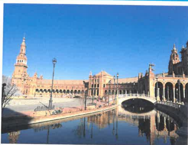
Découverte de l'antiquité en Andalousie en 2014 et 2015